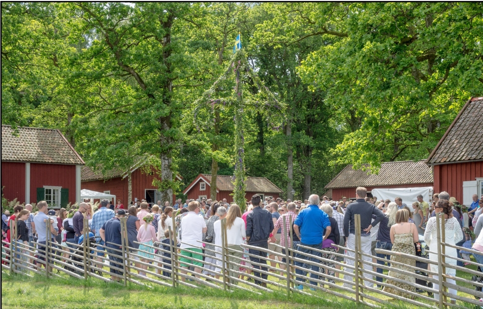
Midsommarfirandet på Hembygdsgården är en av höjdpunkterna på året

Text: Ann-Marie Carlsson Foton och layout: Pelle Dalberg Tryck: Alekuriren