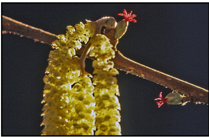
Hassel - hanhängen och honblommor