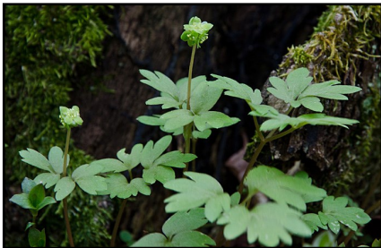
Den lilla desmeknoppen gömmer sig gärna bland vitsippsbladen